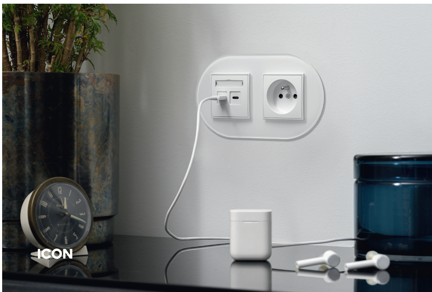
Mechanizm ładowarki USB podwójnej 2x USB C, 20W max. biały mat + mechanizm gniazda pojedynczego z uziemieniem 2P+Z (przesłony torów prądowych) biały mat + ramka uniwersalna podwójna okrągła - efekt szkła (ramka: biała, spód: biały). / Matt white double USB charger mechanism 2x USB C, 20W max. + matt white mechanism single socket with the 2P+Z earth mechanism (with increased contact protection/shutter) + 2-gang universal frame round - glass effect (frame: white, rear: white).

Well-chosen interior accessories are not only functional but also technically reliable items of a house or apartment's equipment. Details can decorate a room and help to emphasize its style, therefore switches and sockets also have a decorative function. /