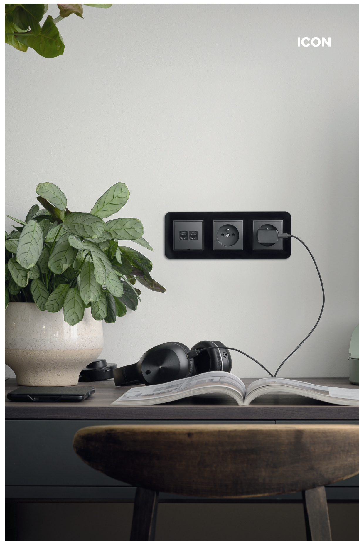
Mechanizm gniazda komputerowego podwójnego 2xRJ45, kat. 5e, 8-stykowy, bez pola opisowego czarny mat + mechanizm gniazda pojedynczego z uziemieniem 2P+Z (przesłony torów prądowych) czarny mat + ramka uniwersalna potrójna zaokrąglona - efekt szkła (ramka: czarna, spód: czarna). / Matt black double computer socket mechanism 2xRJ45, cat. 5e, 8-contact, without description field + matt black single socket with the 2P+Z earth mechanism (with increased contact protection/shutter) + 3-gang universal frame with rounded edges - glass effect (frame: black, rear: black).